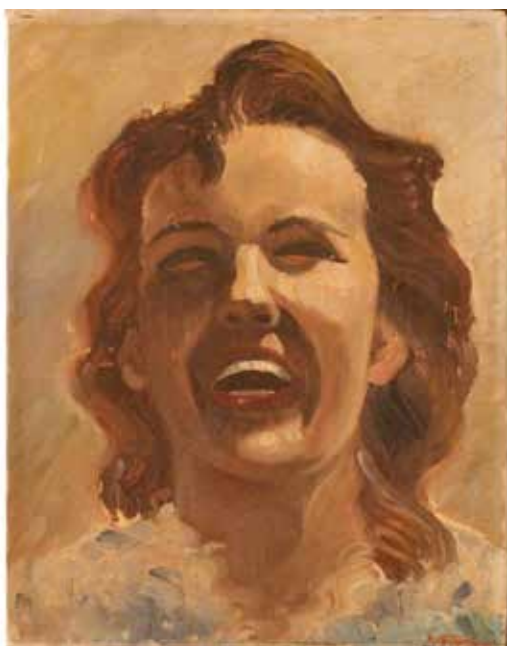
218 VOLTO DI RAGAZZA Dipinto ad olio su tela. Firma indistinta. Secolo XX. Cm 45x35. Prezzo base d'asta € 100