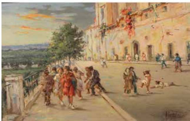
226 A. LERBIANO "La passeggiata domenicale" Dipinto ad olio su faesite in cornice dorata. Cm 68x43 Prezzo base d'asta € 250