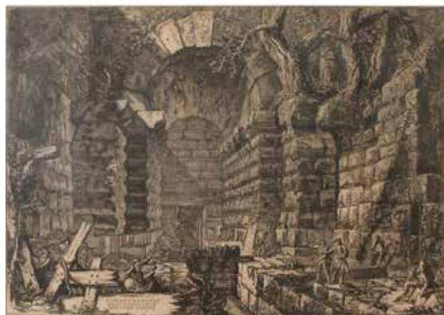
225 FRANCESCO PIRANESI (1758-1810) "Architetture con figure" Incisione in bianco e nero. Cm 65x47. Prezzo base d'asta € 200