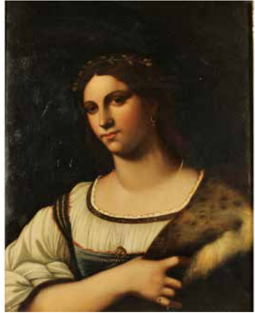
229 SCUOLA FRANCESE DEL SECOLO XIX "Figura di donna con ghirlanda"

Dipinto ad olio su tela in cornice dorata. Cm 52x68.