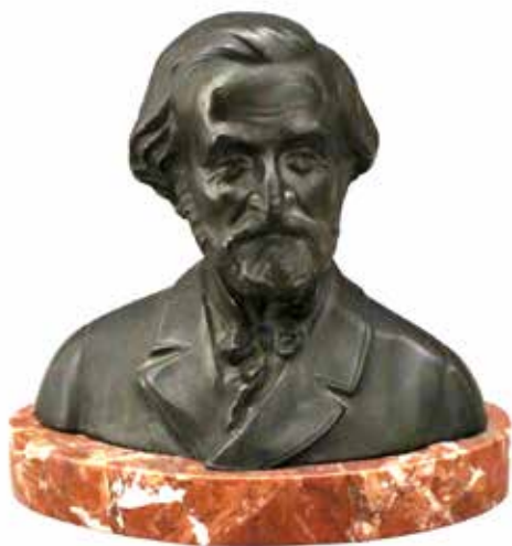
5 GIUSEPPE VERDI Piccolo mezzobusto in bronzo. Secolo XX. Cm H 12. Prezzo base d'asta € 100