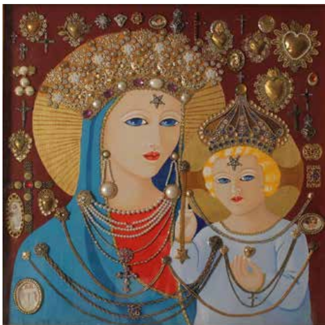
220 TIZIANA MONTI (1945) "Benedetta vergine della strada" Acrilico datato sul retro '08. Cm 58x58. Prezzo base d'asta € 100