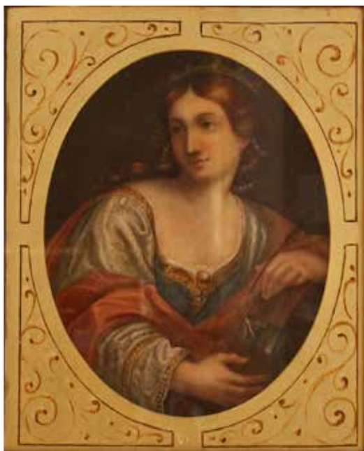
216 SCUOLA ROMANA DEL SECOLO XIX "Figura di dama" Dipinto ovale ad acquarello su cartone in cornice dorata. Cm 28x23. Prezzo base d'asta € 250