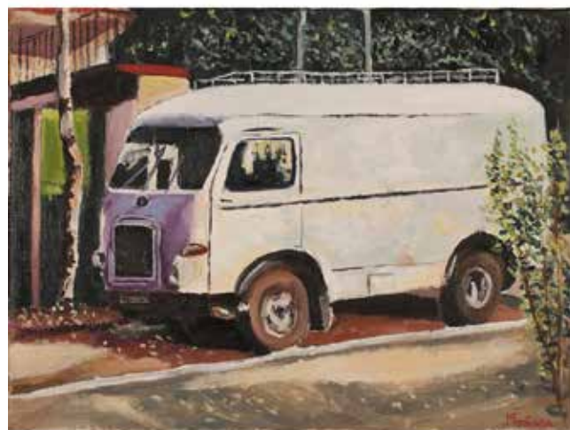
221 MICHELE FONTANA (1965) "Volkswagen" Dipinto ad olio su tela. Datato 2017. Cm 40x30. Prezzo base d'asta € 70