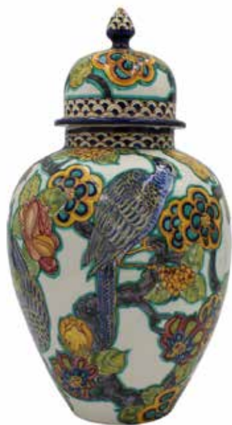
139 POTICHE Ceramica dipinta con volatili e motivi floreali. Nord Italia, secolo XX. Cm H 45 Prezzo base d'asta € 50