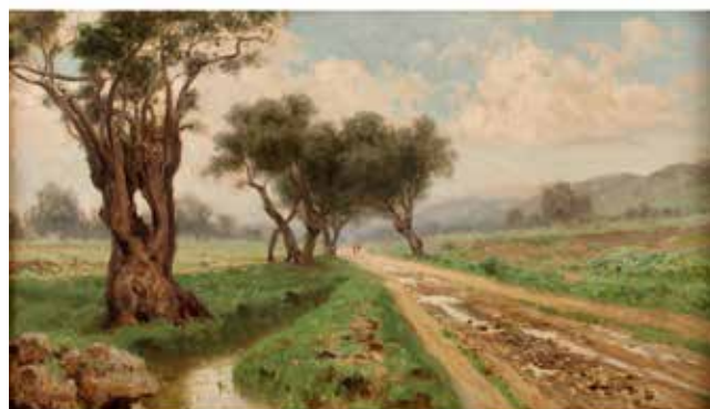
324 FRANCESCO LOJACONO (1841-1914) "Dopo la pioggia" Importante dipinto ad olio su tela in cornice in legno dorato. Cm 86x48. Prezzo base d'asta € 8000