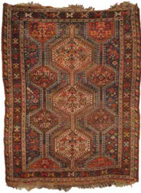
41 TAPPETO PERSIANO Cm 180x133. Prezzo base d'asta € 50