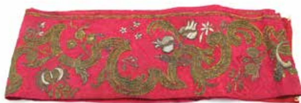
140 STOLA SU SETA Decorazioni a filo d'oro e d'argento a motivi vegetali e floreali. Fine secolo XIX. Cm 240x20. Prezzo base d'asta € 80