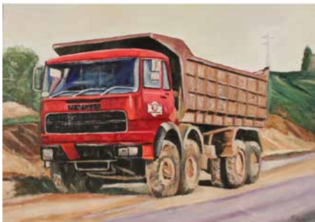
222 MICHELE FONTANA (1965) "Camion rosso" Dipinto ad olio su tela. Datato sul retro 2016. Cm 105x72. Prezzo base d'asta € 120