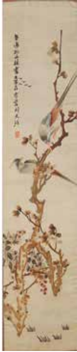
349 VOLO DI RONDINI Ricamo su seta in cornice scura. Cina. Fine secolo XIX. Cm 103x23. Prezzo base d'asta € 150