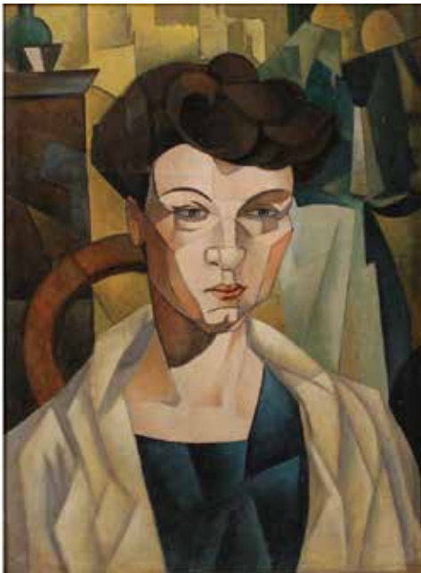
230 FIGURA DI DONNA

Dipinto ad olio su tela in cornice dorata. Cm 30x40.