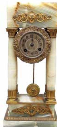
8 OROLOGIO DA TAVOLO Onice con quattro colonne laterali e applicazioni di bronzi dorati. Francia, fine secolo XIX. Cm H 34. Prezzo base d'asta € 80