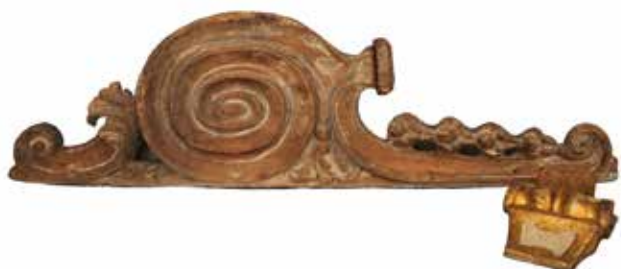
1 LOTTO DI DUE FREGI Legno scolpito e dorato. Secolo XVIII. Cm H 112 e Cm H 20. Offerta libera