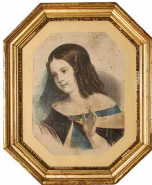
176 FIGURA DI FANCIULLA Stampa ottagonale policroma su carta in cornice in legno dorato. Secolo XIX. Firmata La Fosse. Cm 44x33. Prezzo base d'asta € 80