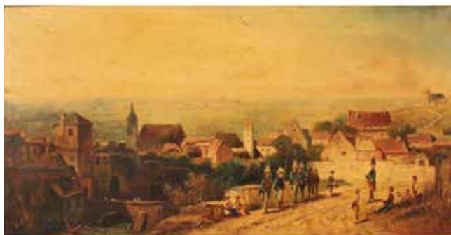
175 P.T. COLL "Bambini assistono al cambio della guardia" Dipinto ad olio su tela in bella cornice dorata. Cm 74x39. Prezzo base d'asta € 300