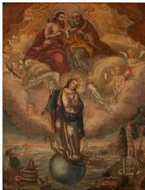
346 SCUOLA SICILIANA DEL SECOLO XVIII "Scena sacra" Dipinto ad olio su tela riportata su tavola. Cm 33x25. Prezzo base d'asta € 400