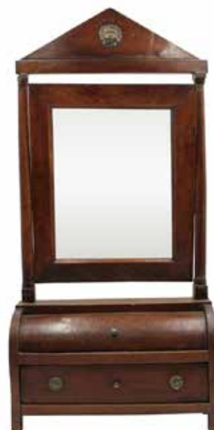
2 MODELLINO DI TOILETTA Mogano. Sicilia. Secolo XIX. Cm 34 H 72. Prezzo base d'asta € 80