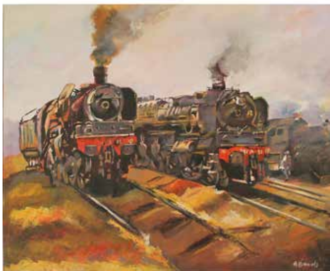
137 ROLAND BONNALD "Treni" Acrilico su tela in cornice. Opera certificata. Datato 2019. Cm 60x73. Prezzo base d'asta € 280