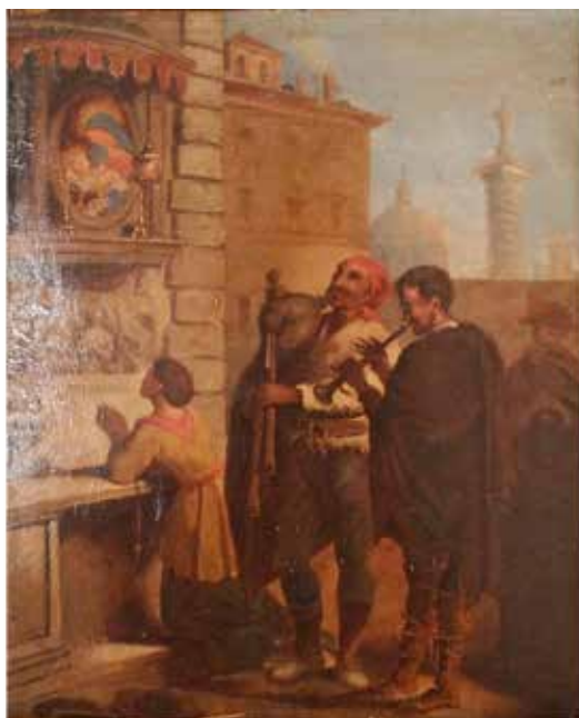
345 PITTORE ROMANO DEL SECOLO XIX "Concertino all'immagine della Madonna" Dipinto ad olio su tavola in cornice dorata, Cm 34,5x44. Prezzo base d'asta € 300