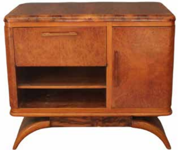
237 MOBILE BAR Noce bionda, due sportelli e un ripiano. Epoca Art Decò. Cm 84x38 H 70. Prezzo base d'asta € 250