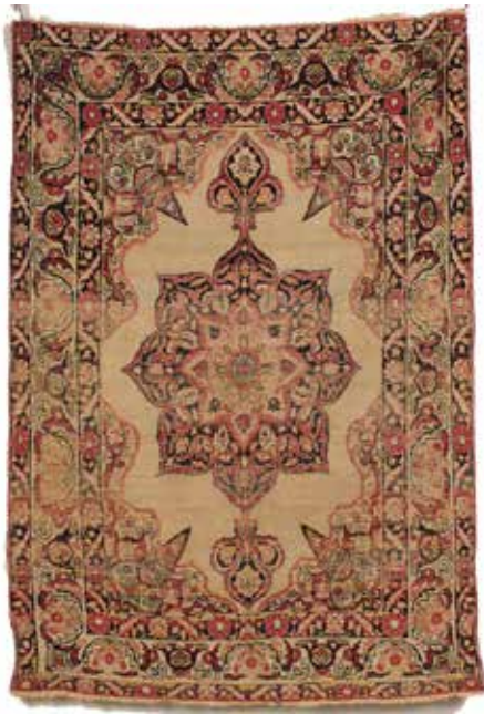
35 COPPIA DI TAPPETI PERSIANI Cm 171x118. Prezzo base d'asta € 150