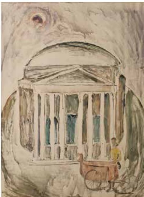
351 VEDUTA DEL PANTHEON China ed acquerello su carta. Secolo XX. Cm 48x65. Prezzo base d'asta € 120