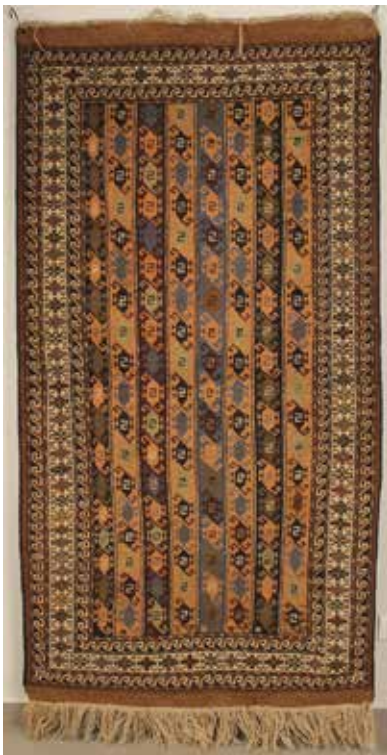
43 TAPPETO PERSIANO Cm 220x113. Prezzo base d'asta € 50