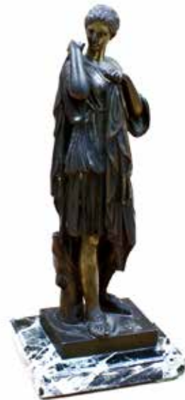
14 FIGURA CLASSICA Scultura in bronzo patinato. Francia, secolo XIX. Cm H 29. Prezzo base d'asta € 120