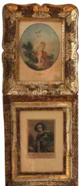
21 LOTTO DI DUE CORNICI Legno inciso e dorato. Sicilia, secolo XIX. Cm 30,5x23, 23,5x31,5. Prezzo base d'asta € 280