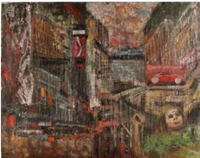
127 CROCE TARAVELLA (1964) "Contrazione urbana" Olio e incisione su tela. Anno di esecuzione 2015. Cm 92x73. Prezzo base d'asta € 1100