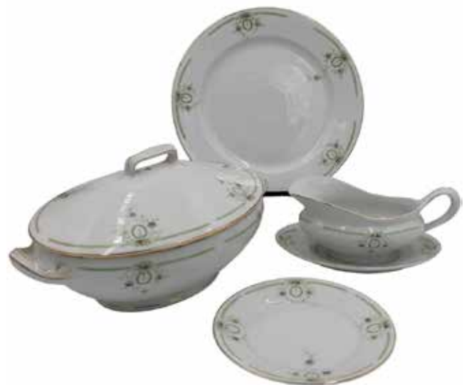
207 SERVIZIO DI PIATTI Porcellana. Marcato Bavaria, composto da: una zuppiera, due alzate, una salsiera, una insalatiera, due piatti da por- tata, un piatto tondo da portata, 26 piatti piccoli, 21 piatti piani e 12 piatti fondi. Secolo XX. Prezzo base d'asta € 150