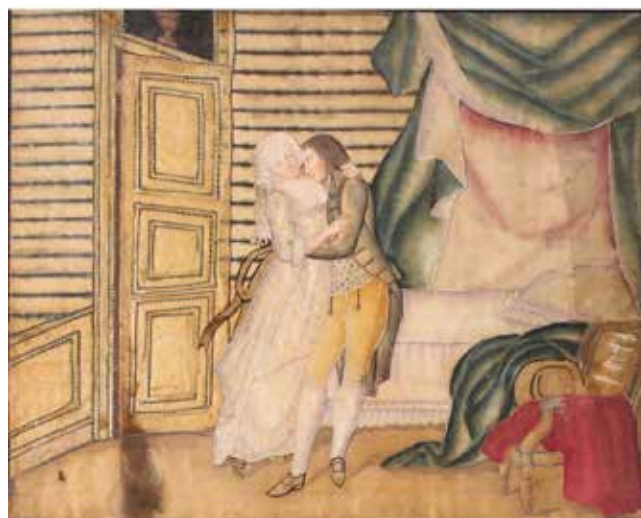
322 SCUOLA FRANCESE DEL SECOLO XIX "Scene galanti" Coppia di collage dipinti su carta. Cm 43x35. Prezzo base d'asta € 750