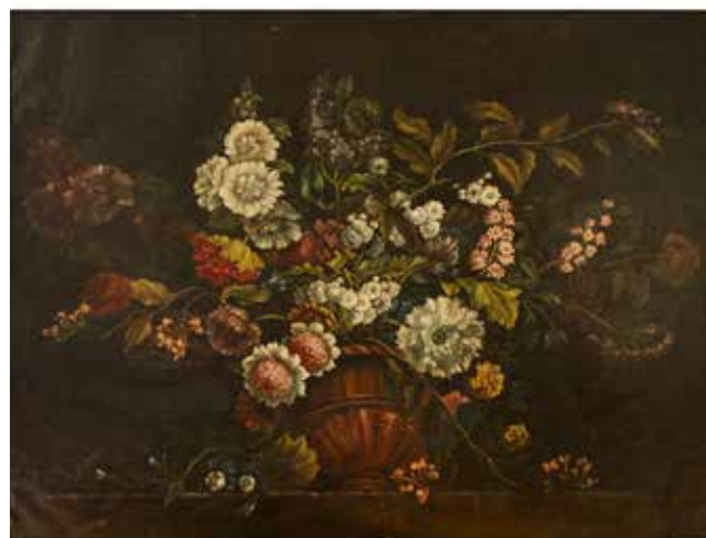
217 SCUOLA SICILIANA DEL SECOLO XIX "Natura morta di fiori" Grande dipinto ad olio su tela in cornice. Cm 116x89. Prezzo base d'asta € 1100