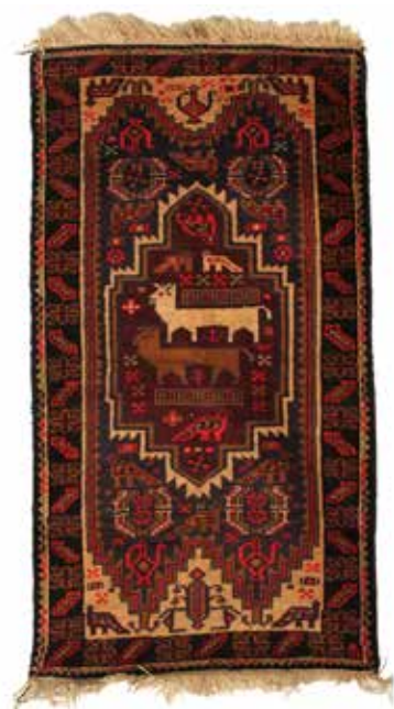
36 TAPPETO PERSIANO Cm 150x81. Prezzo base d'asta € 50