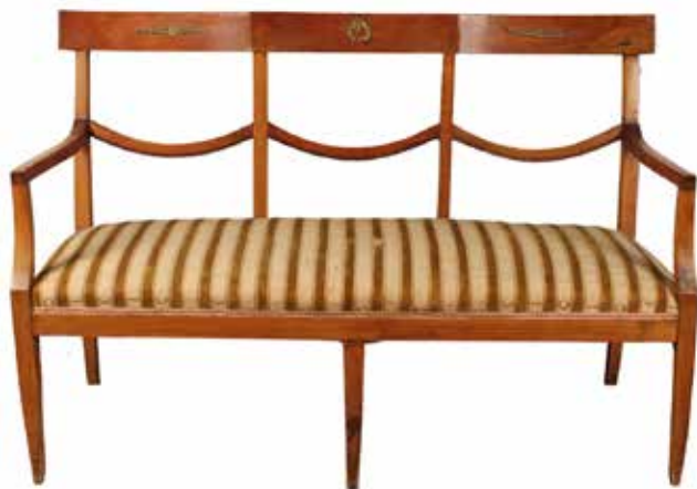
238 COPPIA DIVANI Noce scolpito con applicazioni in bronzo dorato. Sicilia, secolo XIX. Cm 128x46 H 88 Prezzo base d'asta € 250