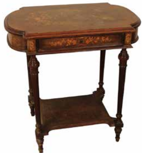
239 POUFREUSE Palissandro con intarsi a motivi floreali in bosso. Francia, fine secolo XIX. Cm 70x43 H 76. Prezzo base d'asta € 150