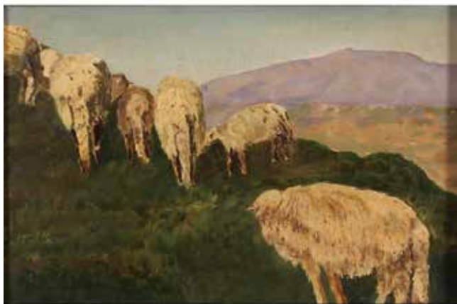
23 PECORE AL PASCOLO Dipinto ad olio su tela in cornice dorata. Firmato Gaetano Samalidro. Secolo XX. Cm 24x16. Prezzo base d'asta € 80