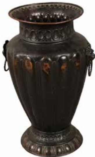
15 PORTA BASTONI Metallo con teste di leoni sui laterali. Fine secolo XIX. Cm H 56. Prezzo base d'asta € 40