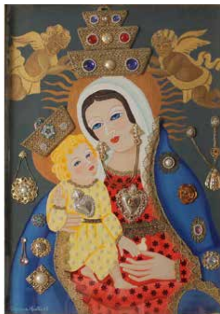
219 TIZIANA MONTI (1945) "Maria SS. delle tre corone" Acrilico datato sul retro '08. Cm 68x48. Prezzo base d'asta € 100