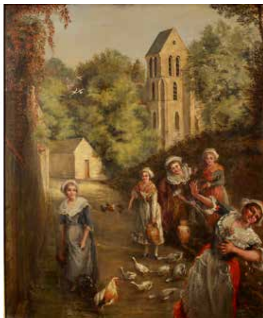
174 J.A. DELIT "Giochi nel cortile" Dipinto ad olio su tavola in cornice dorata. Cm. 64x54. Prezzo base d'asta € 1000