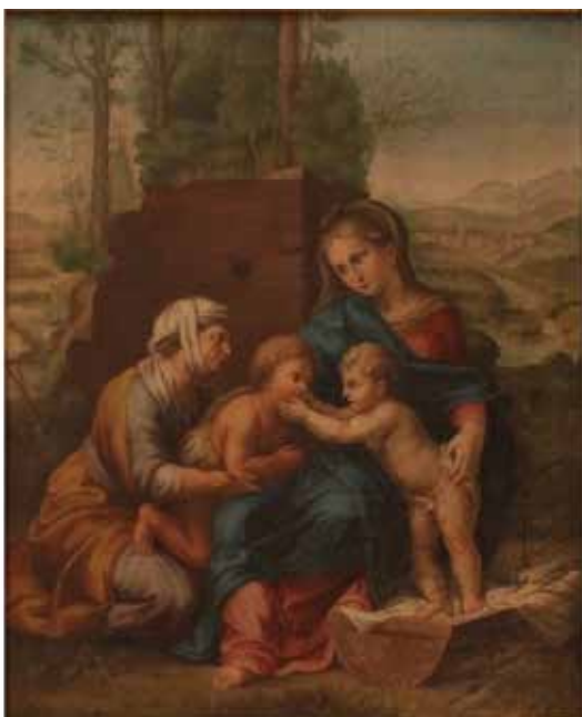
25 SCUOLA SICILIANA INIZI SECOLO XIX "La Madonna col Bambino, San Giovannino e Sant' Anna" Dipinto ad olio su tela in cornice dorata. Cm 36x29. Prezzo base d'asta € 300