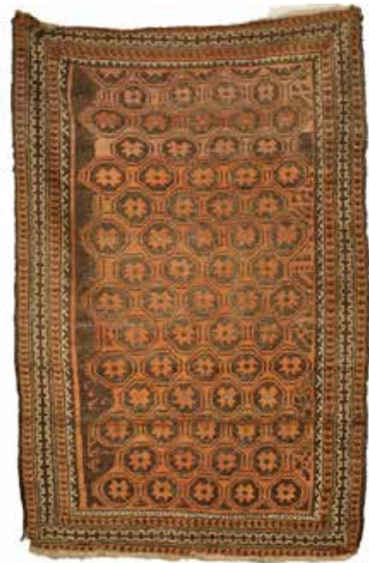
42 TAPPETO PERSIANO Cm 95x128. Prezzo base d'asta € 70