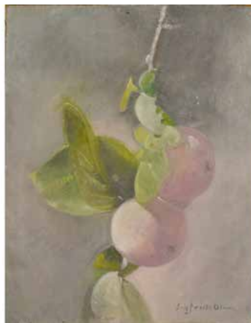
32 SIGFRIDO OLIVA (1942) "Ramo con pesche" Dipinto ad olio su tela. Cm 30x24. Prezzo base d'asta € 90