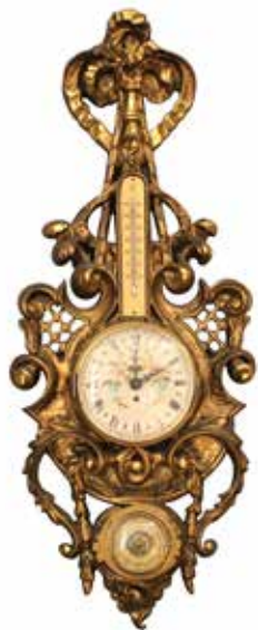
7 BAROMETRO Legno scolpito e dorato. Inizi secolo XX. Cm 68x28. Prezzo base d'asta € 100