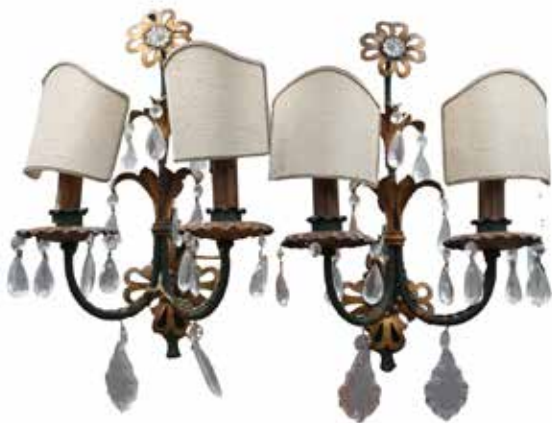
206 COPPIA DI APPLIQUES Due luci con brindoli e fusto in metallo dorato. Secolo XX. Cm H 35. Prezzo base d'asta € 180