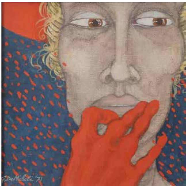
224 GIOXE DE MICHELI (1947) "Volto di donna" Dipinto ad olio su tela in cornice dorata. Datato '71. Cm 30x30. Prezzo base d'asta € 200