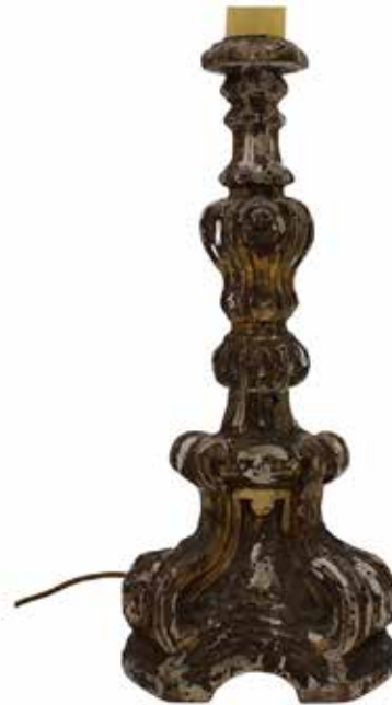
205 LUME Legno scolpito, inciso e dorato (mancanze nella doratura). Sicilia, inizi secolo XIX. Cm H 37 Prezzo base d'asta € 120