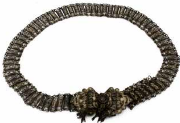
3 CINTURA INDIANA Rame dorato. Secolo XX. Cm 110. Prezzo base d'asta € 80