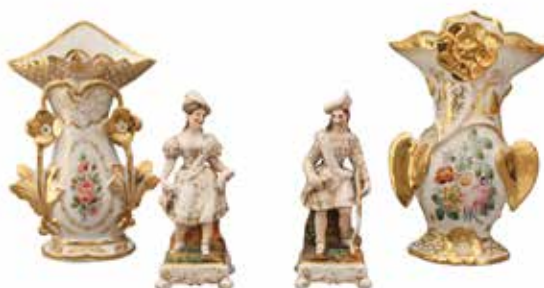
4 LOTTO DI DUE VASI E DUE STATUETTE In antica porcellana policroma. Francia, secolo XIX. Vasi Cm H 29, Statue Cm H 22. Prezzo base d'asta € 120