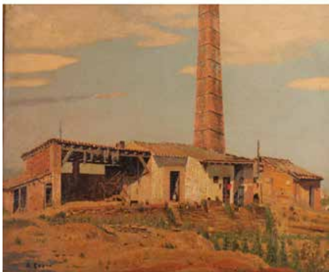
321 R.COSTA "Fattoria in Maremma" Dipinto ad olio su tela in cornice dorata. Cm 61x50. Prezzo base d'asta € 300