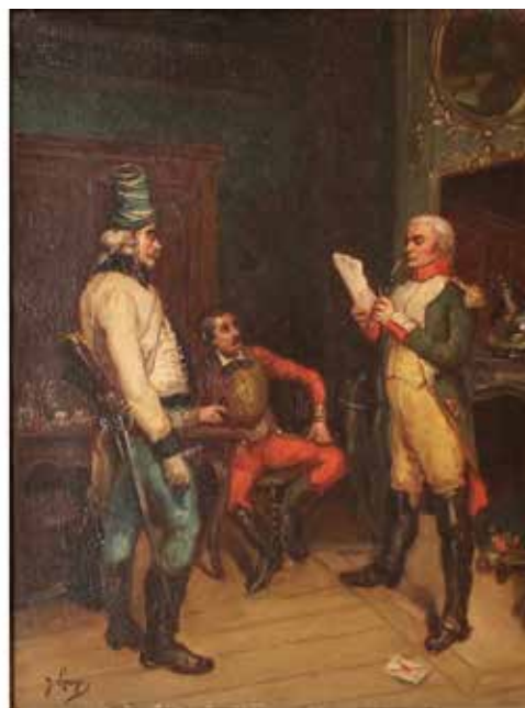
90 Y. LEPAGE "Personaggi in un interno" Dipinto ad olio su tela in cornice dorata. Cm 35x28.