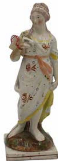
16 RAGAZZA CON UCCELLINO Statuetta in antica maiolica policroma. Secolo XVIII. Cm H 27. Prezzo base d'asta € 100