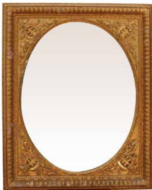
28 GRANDE SPECCHIERA In legno finemente scolpito e dorato a motivi ornamentali e vegetali. Sicilia, secolo XIX. Cm 139x110. Prezzo base d'asta € 350