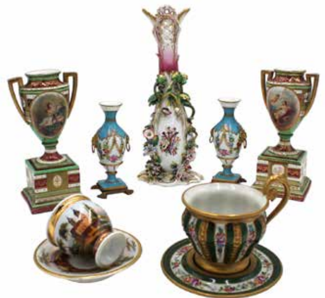
352 LOTTO DI OGGETTI DI VARIO GENERE Porcellana. Fine secolo XIX. Prezzo base d'asta € 400