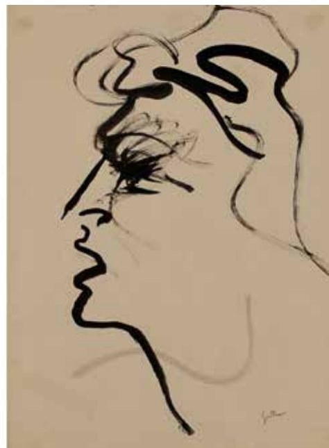
92 RENATO GUTTUSO (1911-1987) "Profilo di donna"

China su carta in cornice dorata. Autentica della Galleria La Rocca. Cm 35x48.