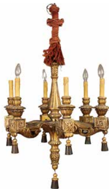
6 LAMPADARIO Sei luci in legno scolpito e dorato. Sicilia, secolo XIX. Cm d 60 H 105. Prezzo base d'asta € 120