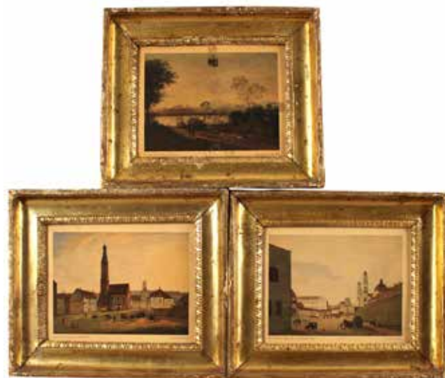
348 LOTTO DI CINQUE PICCOLE CORNICI Legno dorato quattro delle quali canna spaccata ed una in legno inciso e dorato. Sicilia. Secolo XIX Cm 21,5 x 26,5 (misure interne) Cm 27x31,5 (esterne). Prezzo base d'asta € 250