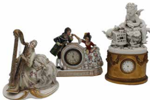
22 LOTTO DI DUE OROLOGI E DUE STATUETTE Porcellana policroma. Secolo XX. Prezzo base d'asta € 130