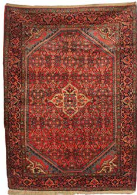
44 TAPPETO PERSIANO Cm 210x150. Prezzo base d'asta € 100