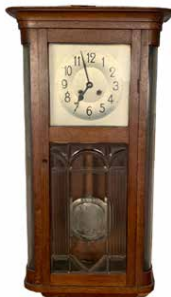
138 PENDOLA DA PARETE Rovere. Sicilia Prezzo base d'asta € 100