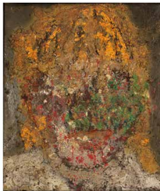
128 CROCE TARAVELLA (1964) "Bambina" Tecnica mista su metallo. Anno di esecuzione 1993. Cm 60x70. Prezzo base d'asta € 700