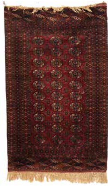
34 TAPPETO PERSIANO Cm 155x95. Prezzo base d'asta € 50