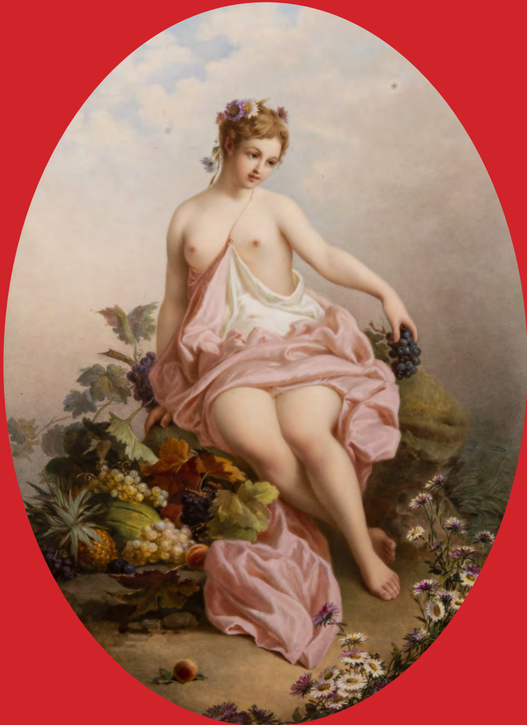
Große ovale Prunkplakette, Meissen 19. Jh. H=43 cm, B=30,5 cm

Freitag, 18. Juni 2021 - 10.00 Uhr Samstag, 19. Juni 2021 - 10.00 Uhr