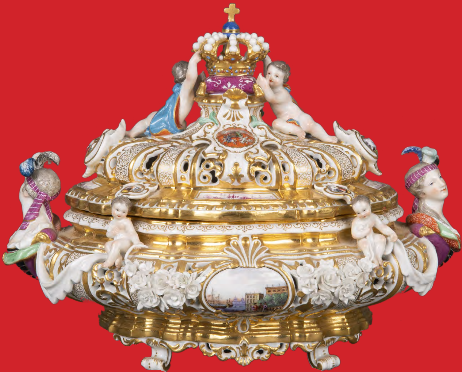
Drüselkästchen, Meissen 19. Jh. Modell nach J. J. Kaendler, H=20 cm, B=25,5 cm, T=18 cm

Besichtigung: Mo., 14., bis Do., 17. Juni 2021, 10:00-18:30 Uhr (unter Vorbehalt)