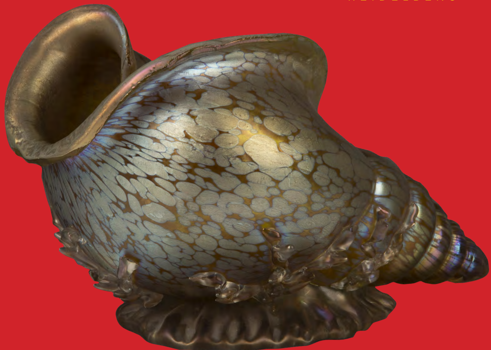
Ziermuschelvase, Loetz, Austria um 1897/98, Dekor „candia papillion“