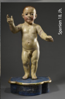
Spanien 18. Jh.