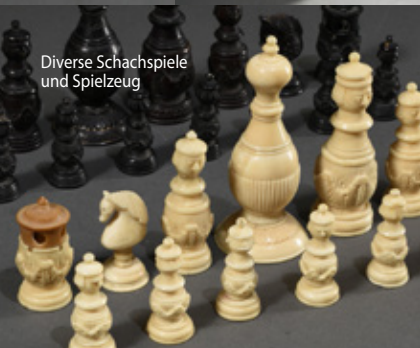
Diverse Schachspiele und Spielzeug