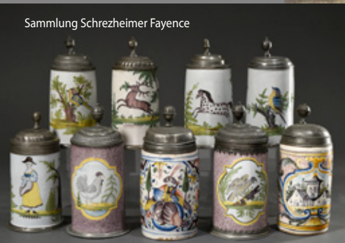
Sammlung Schrezeheimer Fayence