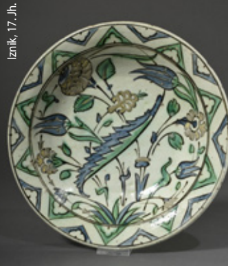
Iznik, 17. Jh.