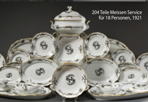
204 Teile Meissen Service für 18 Personen, 1921