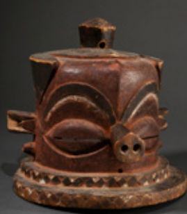
Masken aus der Sammlung Kegel-Konietzko u.a.