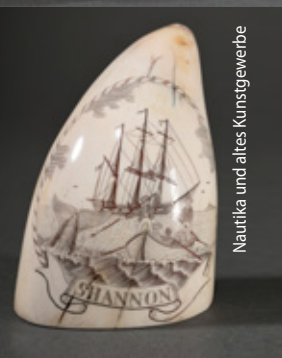
Nautika und altes Kunstgewerbe