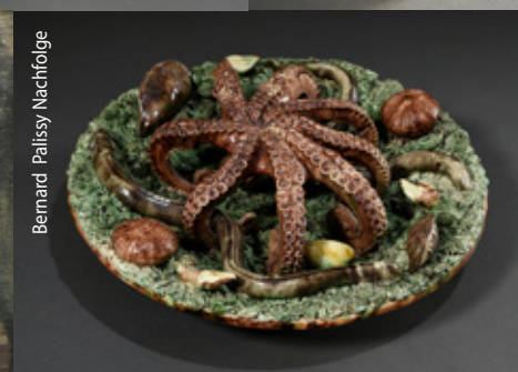
Bernard Palissy Nachfolge