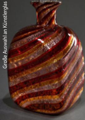
Große Auswahl an Kunstierglas