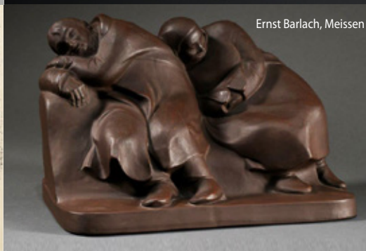
Ernst Barlach, Meissen