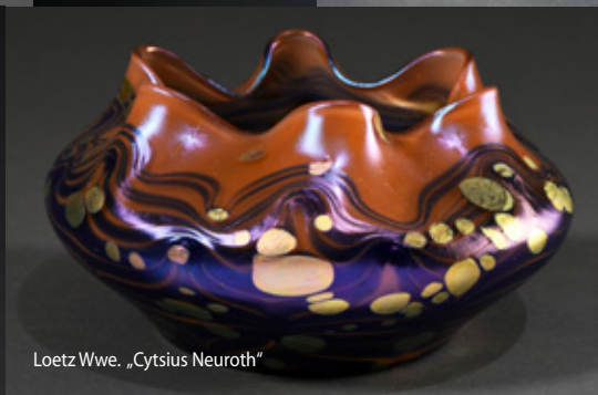
Loetz Wwe. „Cytsius Neuroth“