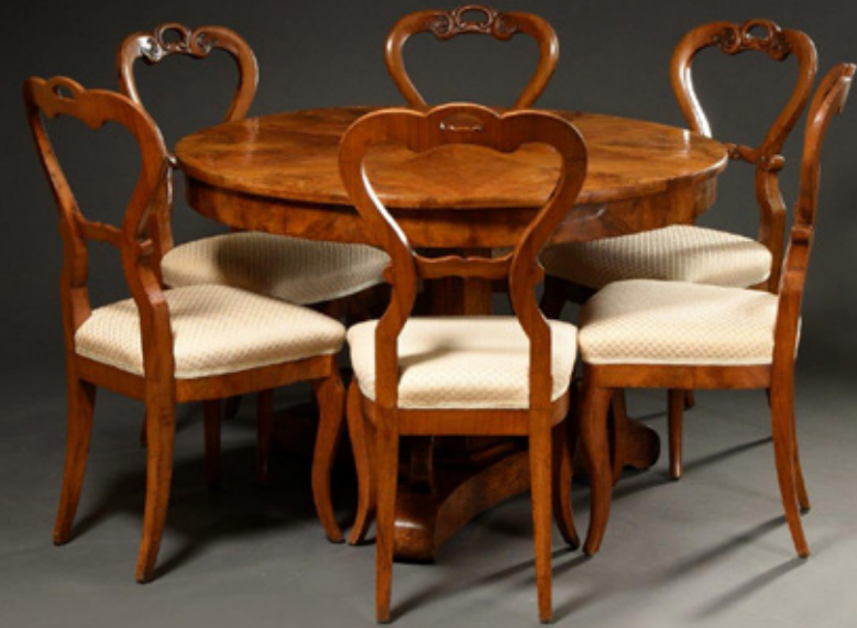
Biedermeier Obstholz Sitzgruppe aus dem Salon der Stefan Zweig Villa am Kapuzinerberg in Salzburg (hier saßen u.a. Thomas Mann, Romain Rolland, Hugo v. Hofmannsthal, James Joyce, Maurice Ravel, Richard Strauss, Alban Berg, Béla Bartók, Arturo Toscanini etc.), dazu Provenienznachweis und eidesstattliche Erklärung