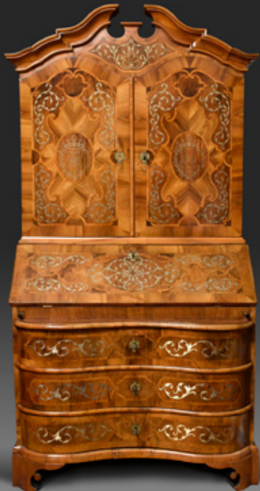
Sachsen um 1740