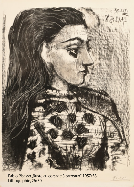
Pablo Picasso „Buste au corsage à carreaux“ 1957/58, Lithographie, 26/50