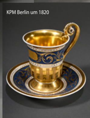
KPM Berlin um 1820