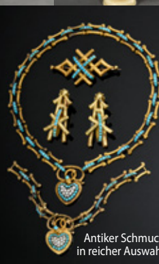
Antiker Schmuck in reicher Auswahl