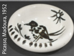
Picasso, Madoura, 1952