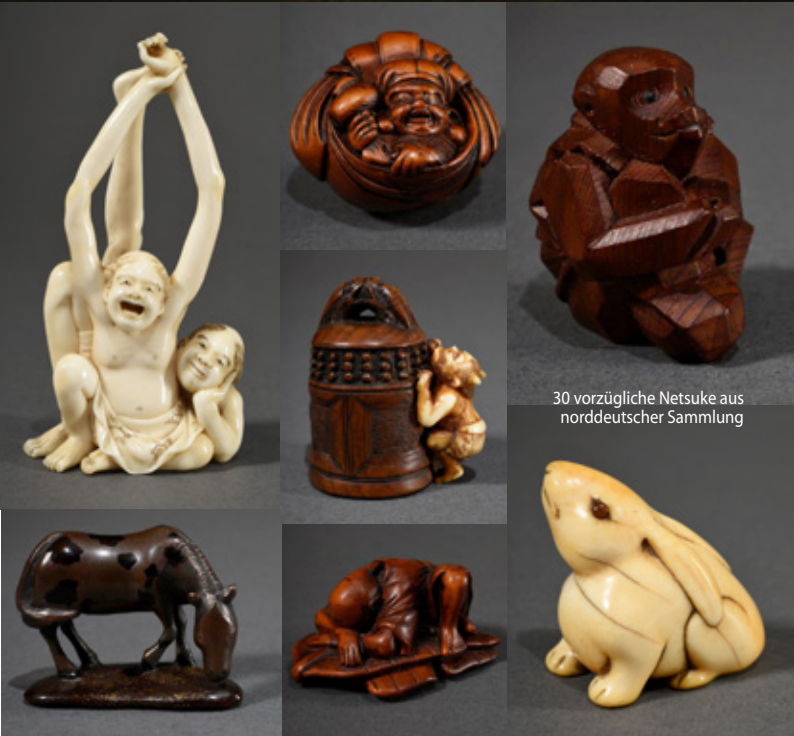
30 vorzügliche Netsuke aus norddeutscher Sammlung