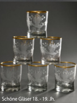
Schöne Gläser 18. - 19. Jh.