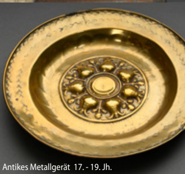
Antikes Metallgerät 17. - 19. Jh.