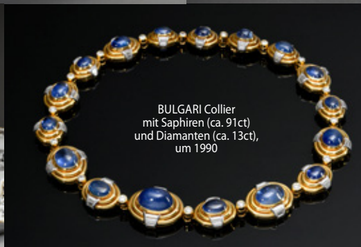
BULGARI Collier mit Saphiren (ca. 91ct) und Diamanten (ca. 13ct), um 1990