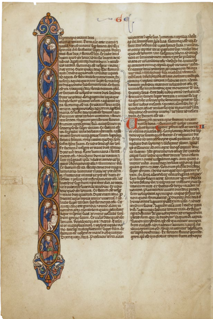
Nr. 7: Biblia latina ... Lateinische Handschrift auf Pergament. Nordfrankreich, Ende d. 13. Jhdts. – Daraus: Anfang der Genesis mit Randleiste in Gold und Farben, mit Darstellung der Werke der sieben Tage. (Originalgröße)