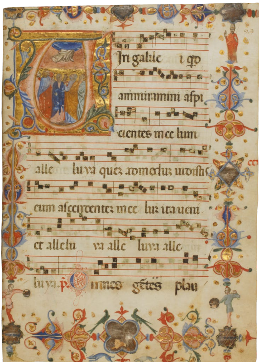
Nr. 2: Antiphonar. Lateinische Handschrift auf Pergament, Mittelitalien um 1350. Bl. 94 recto: Initiale »V« mit Darstellung Christi Himmelfahrt.