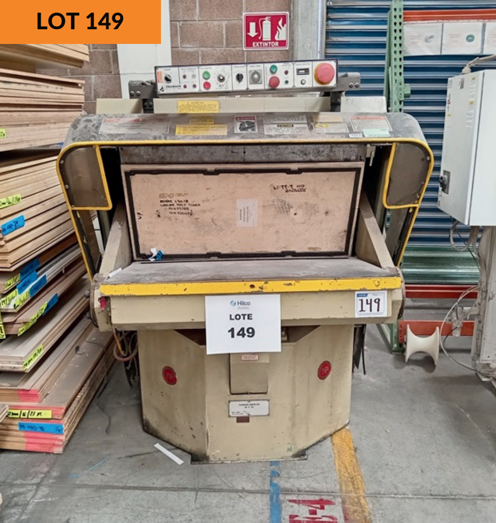
Impresora por transferencia de calor Thomson America Sublimation Heat Transfer Printing Machine Thomson America