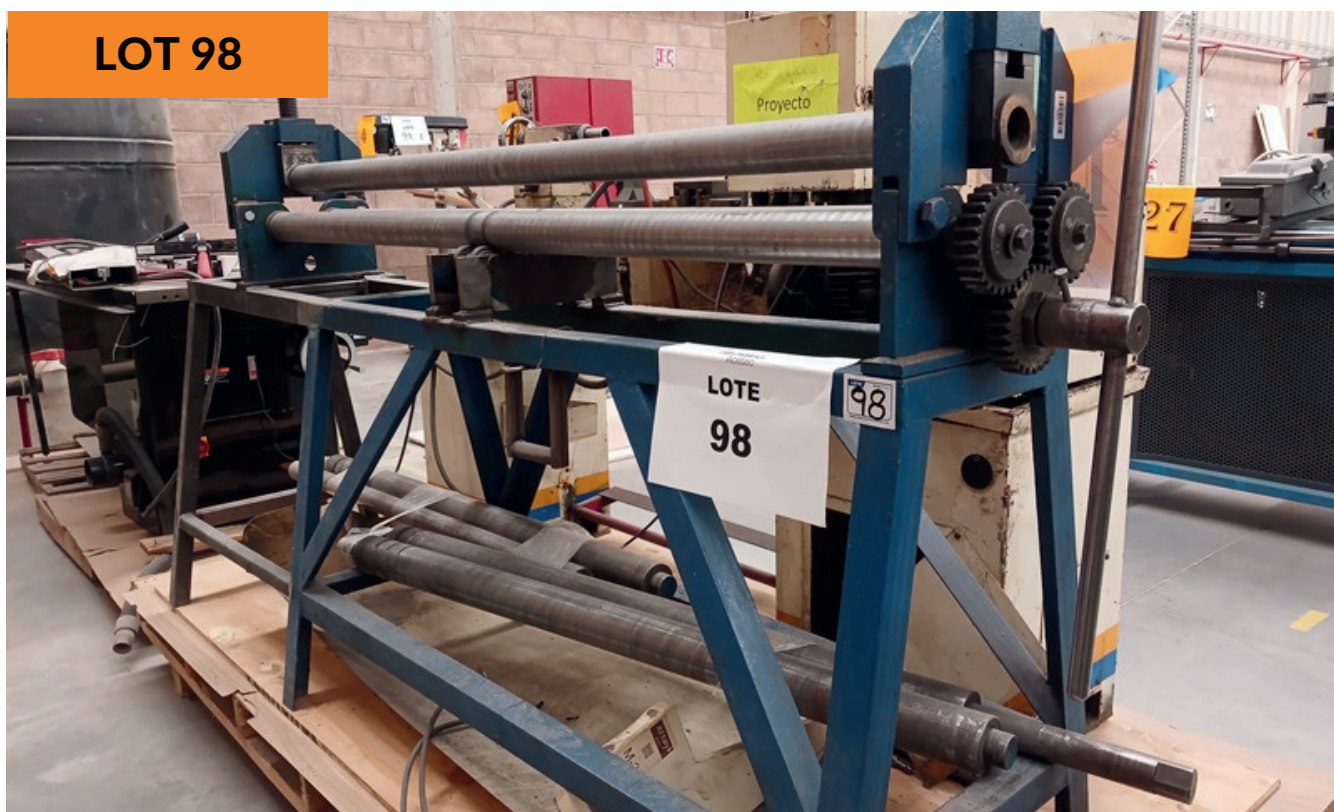
Máquina de rodillo deslizante