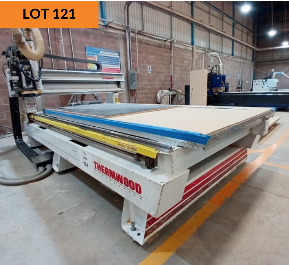
CNC Router Thermwood año 2009 5'x10' Thermwood CNC Router 5'x10' yr 2009