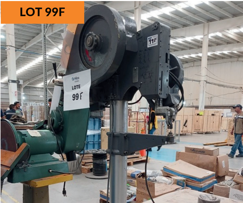
Máquina rivetedora Troyan Rivet Troyan Rivet Riveting Machine