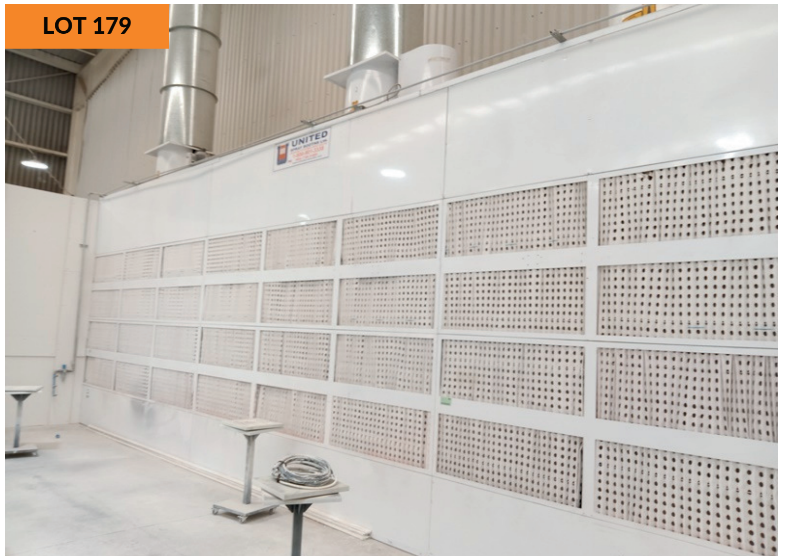
Pared de succión de barniz 11m x 3.7m