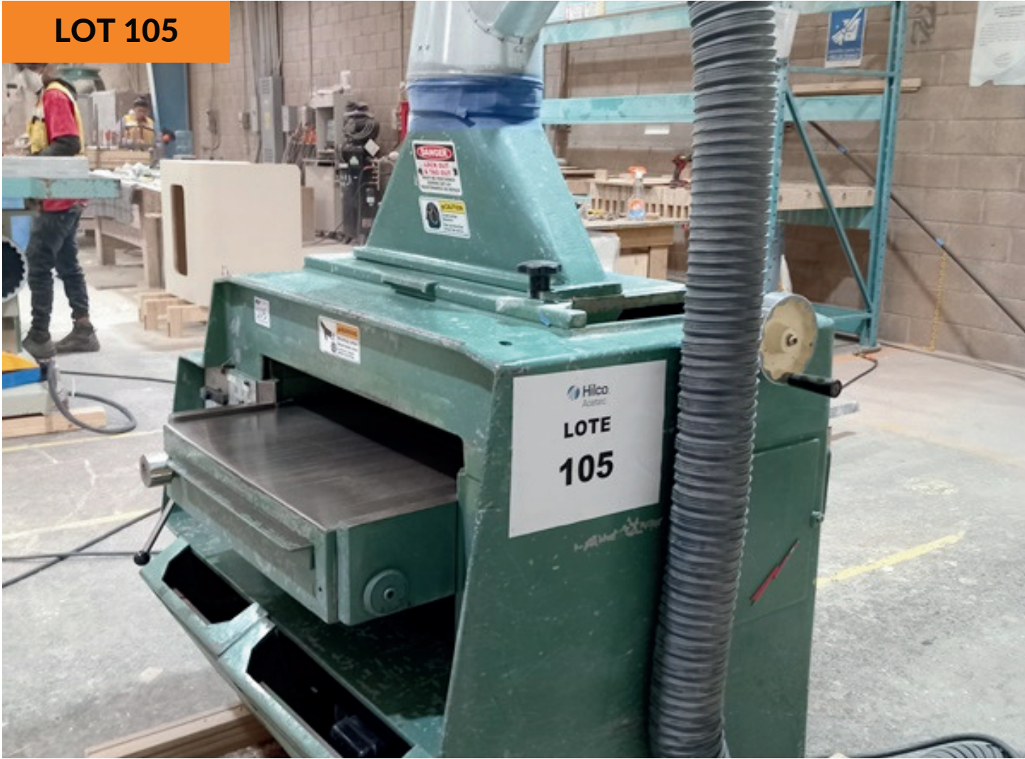
Cepilladora de madera 630mm ancho de corte 630mm wide Wood Brushing Machine