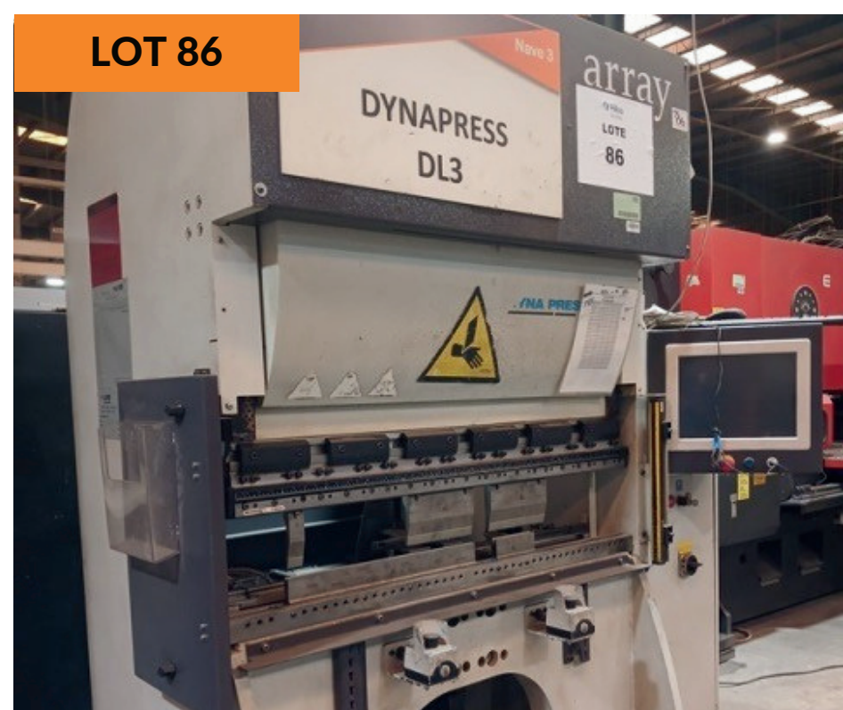
Dobladora Dyna Press 240kN Press Brake Machine, Dyna Press 240kN