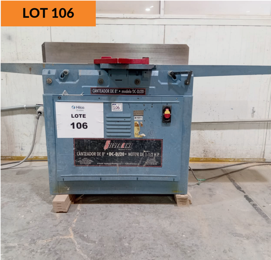
Máquina canteadora Silverline 8" Silverline Wood Edge Brushing Machine 8"