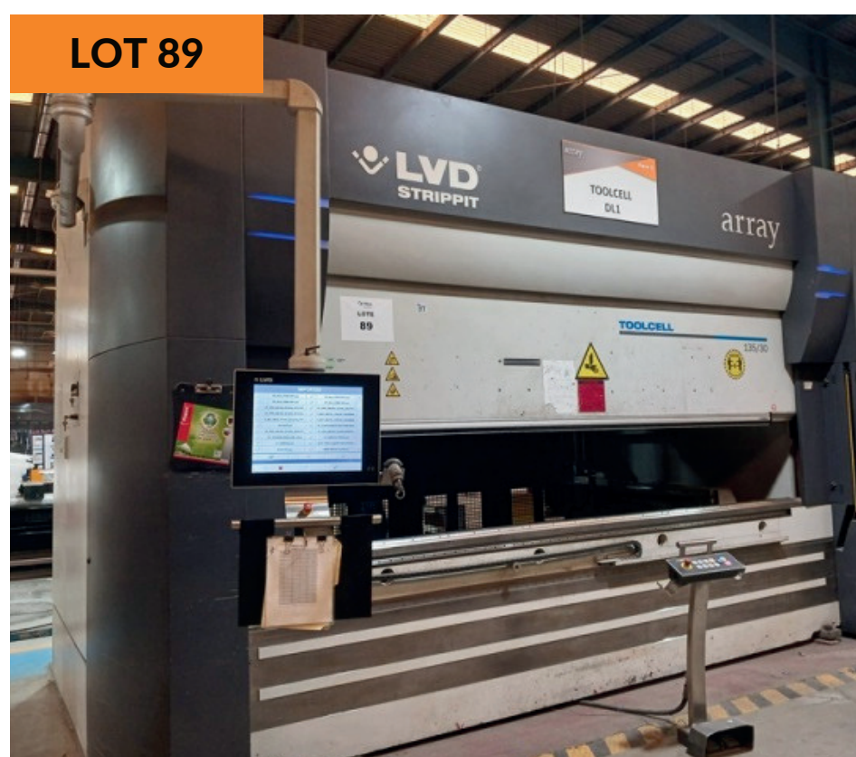
Prensa dobladora 1,350kN año 2018 Press Brake Machine 1,350kN yr 2018