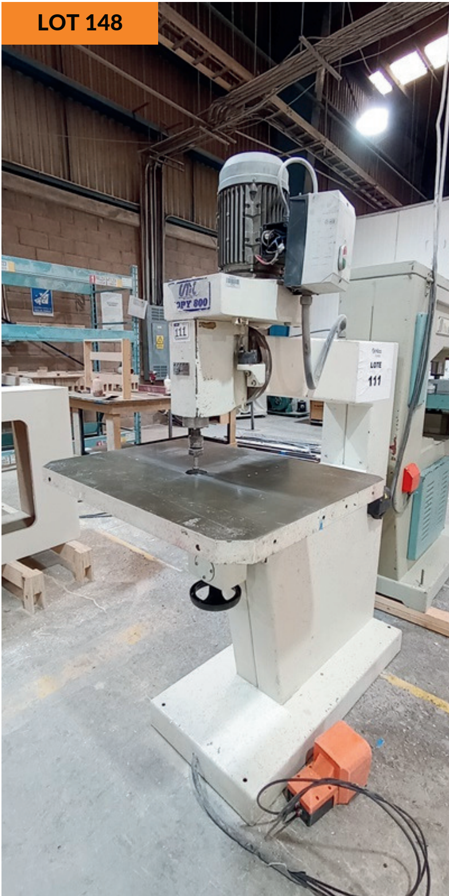
Router manual CMC año 2013 CMC Manual Router yr 2013