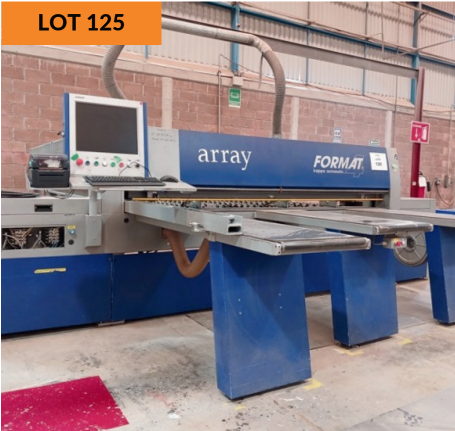
Seccionadora de paneles Felder/Format4 Felder/Format4 Panel Saw Machine