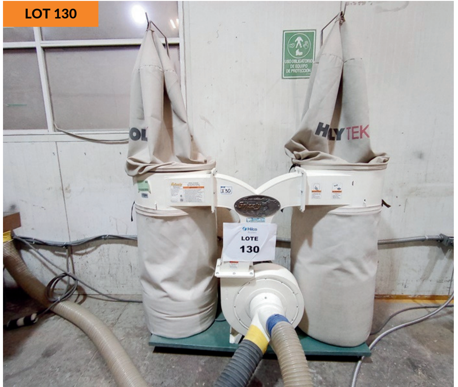
Colector de polvos Grizzly