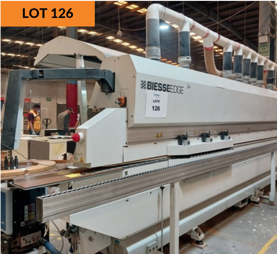
Enchapadora de cantos Biesse 22kW Biesse Edgebander 22kW