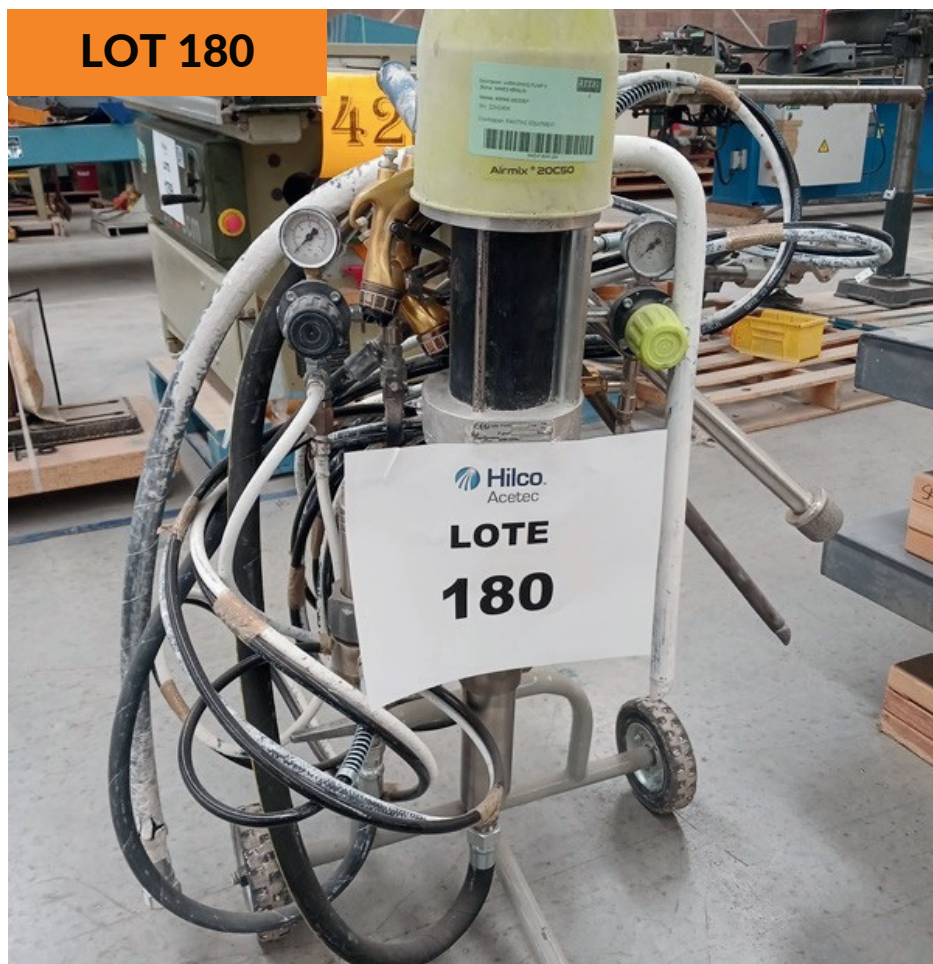
Bomba barnizadora Sames Kremlin Kremlin Varnish Pump