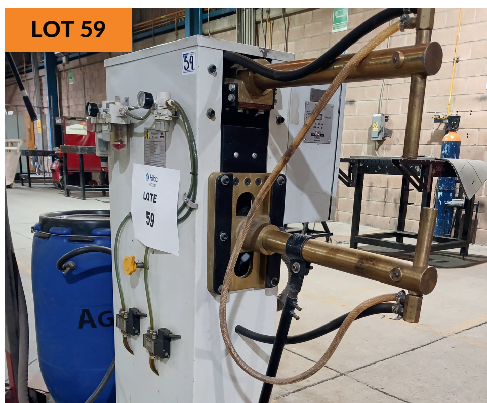
Máquina soldadura punteadora Pirámide 30kVA Piramide Spot Welding Machine 30kVA