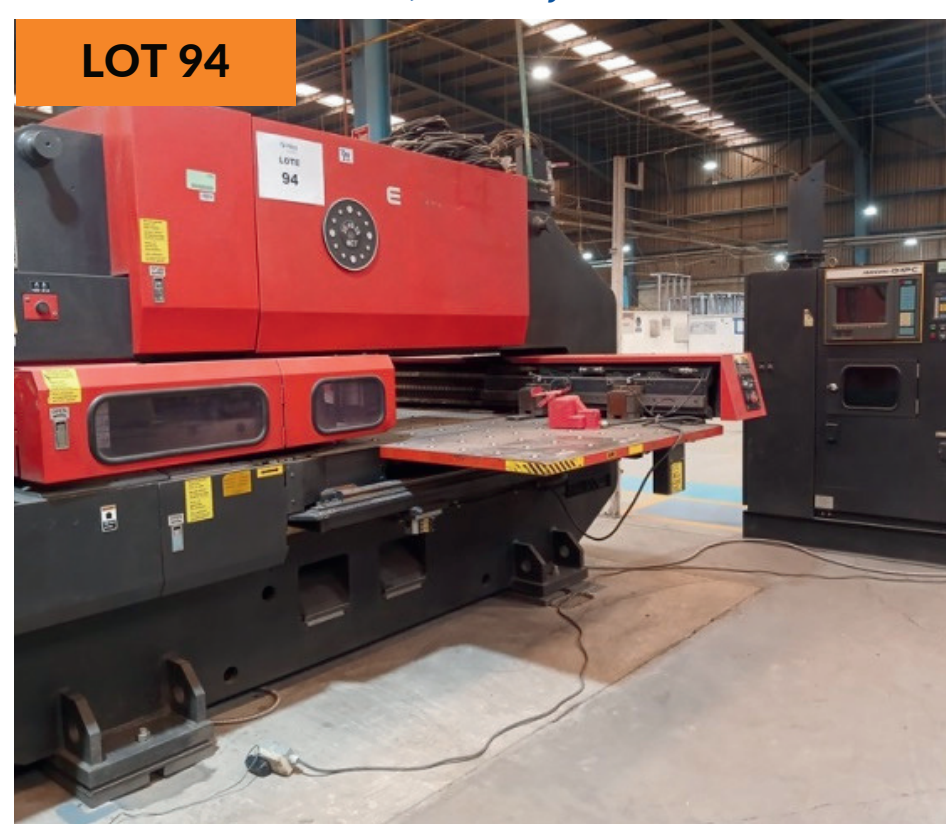
Prensa punzonadora de torreta 30tons 30tons Turret Punch Press