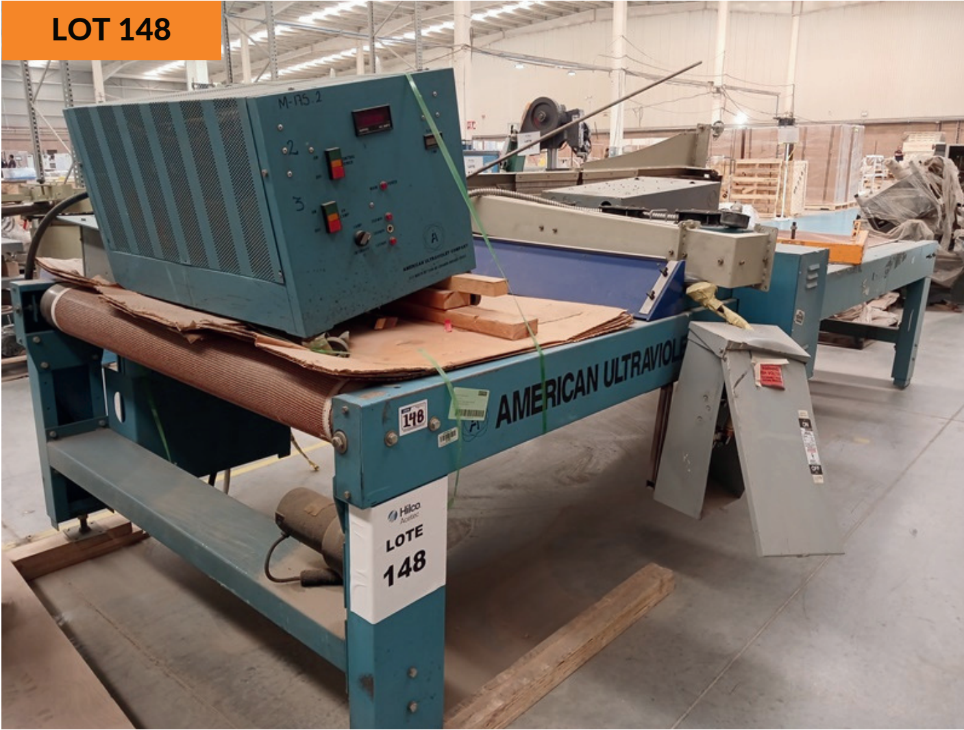
Termoformadora 48" Thermoforming Machine 48"