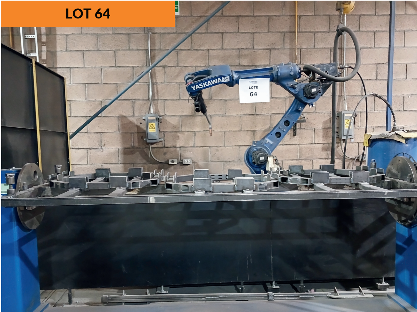
Robot brazo de soldadura Yaskawa año 2016 Yaskawa Welding Arm Robot yr 2016