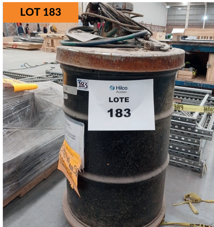
Bomba de pegamento Graco Graco Glue Pump