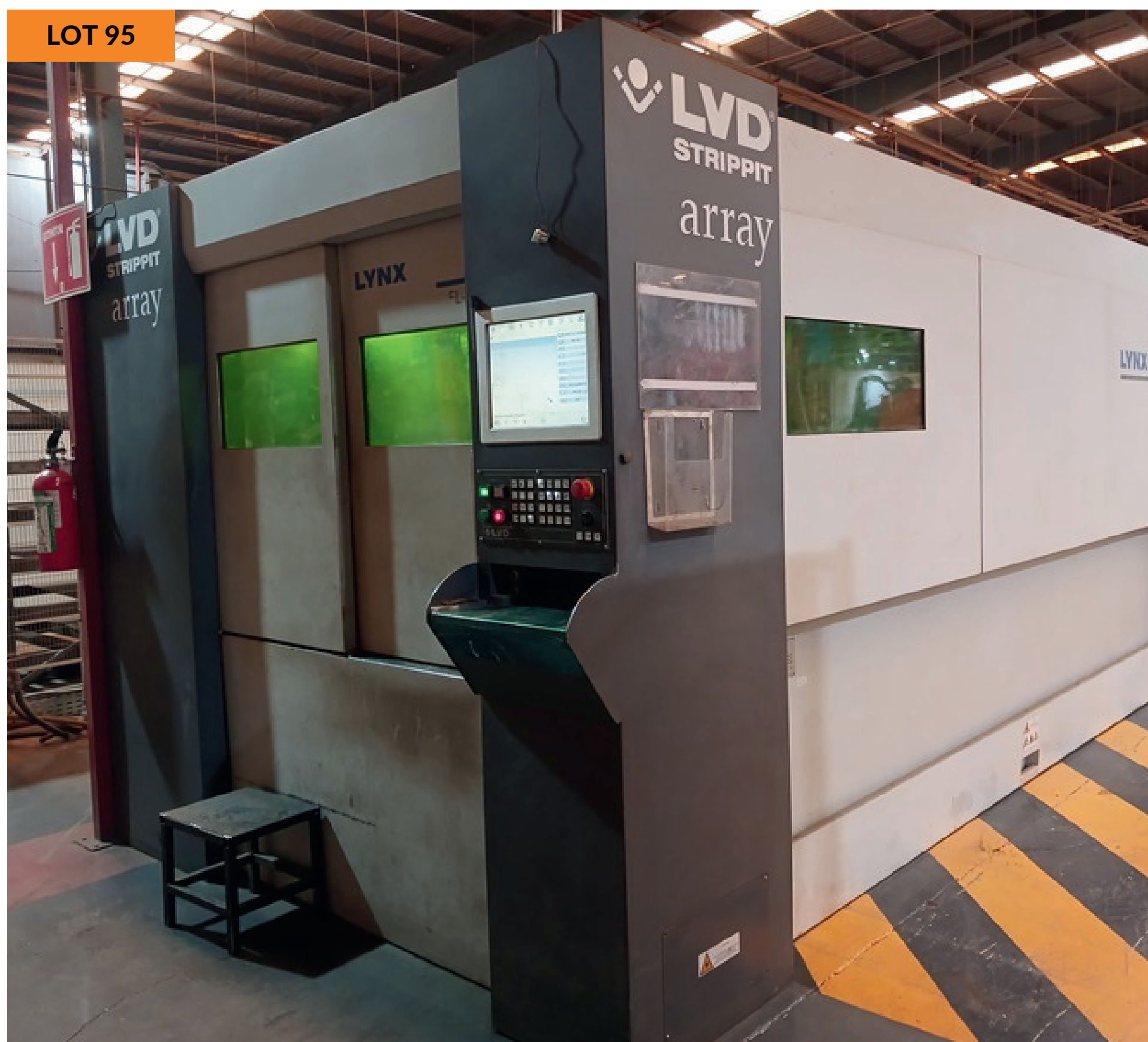
Máquina de corte por láser LVD, Lynx 3015 año 2018 LVD Laser Cutting Machine, Lynx 3015 yr 2018