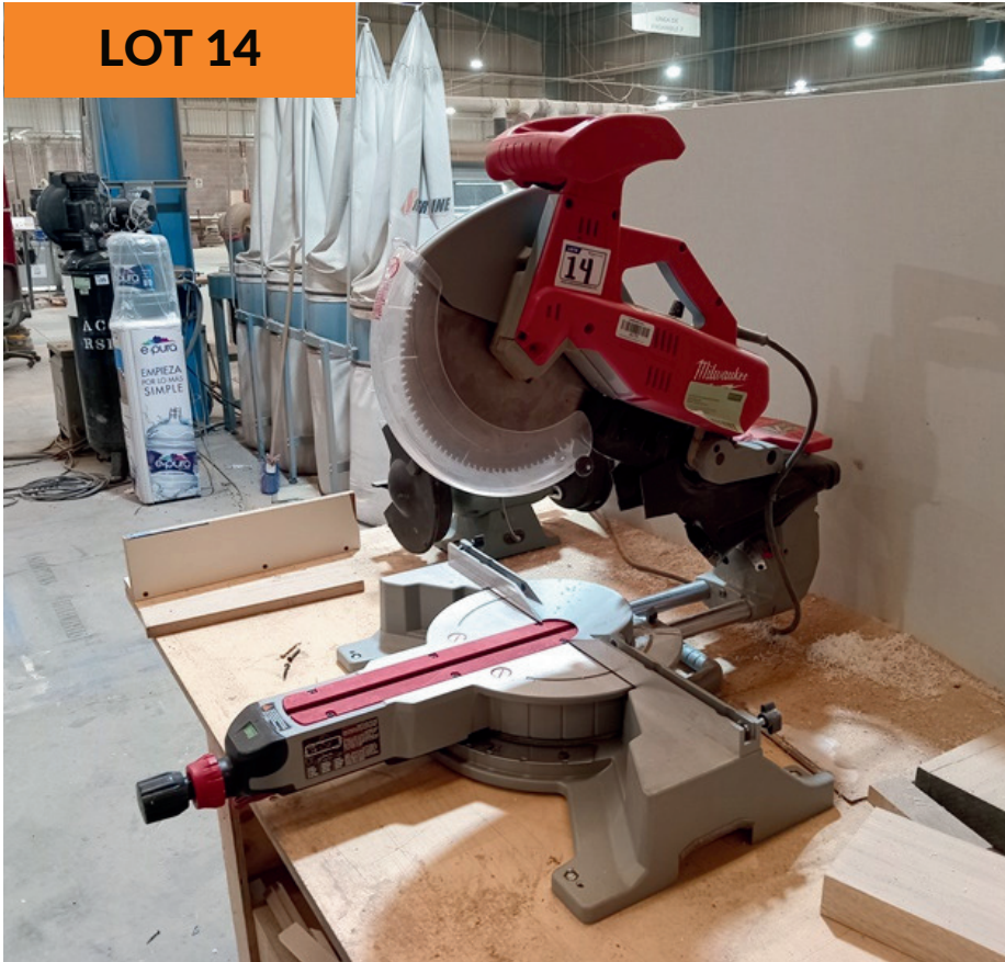
Sierra ingleteadora Milwaukee Milwaukee Milter Saw