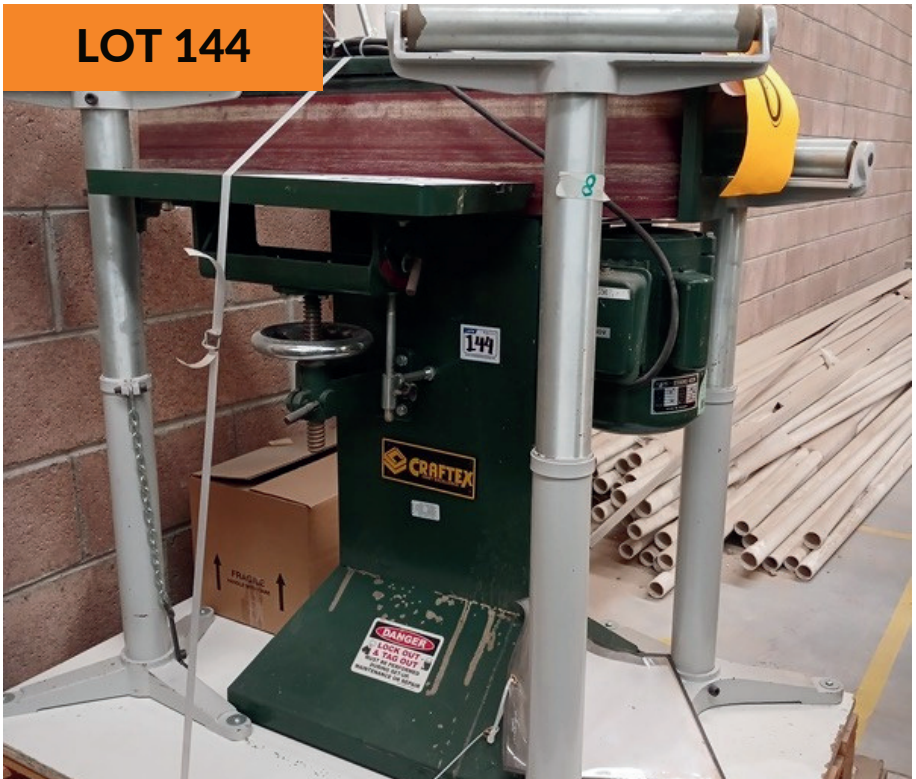
Máquina lijadora de borde Craftex Craftex Edge Sander Machine