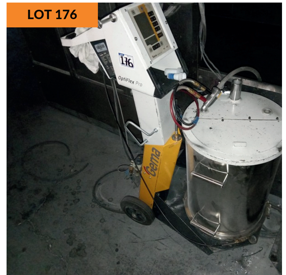
Máquina de recubrimiento de polvo Gema Gema Powder Coating Machine